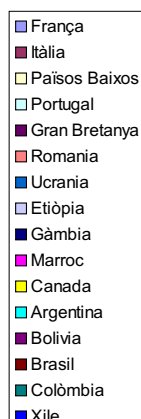
La immigració al nostre poble. Segons número de persones

- Actualment estem treballant un projecte d'hàbits alimentaris en la confecció d'esmorzars i berenars per a tots els pares i mares de les Planes d'Hostoles . En aquest projecte hi estan implicats l'escola, l'àrea bàsica de salut com també l'entitat Creu Roja que ja fa uns quants anys que està treballant amb el seu grup de voluntàries en el municipi. Properament esperem donar-vos més notícies d'aquest nou projecte.